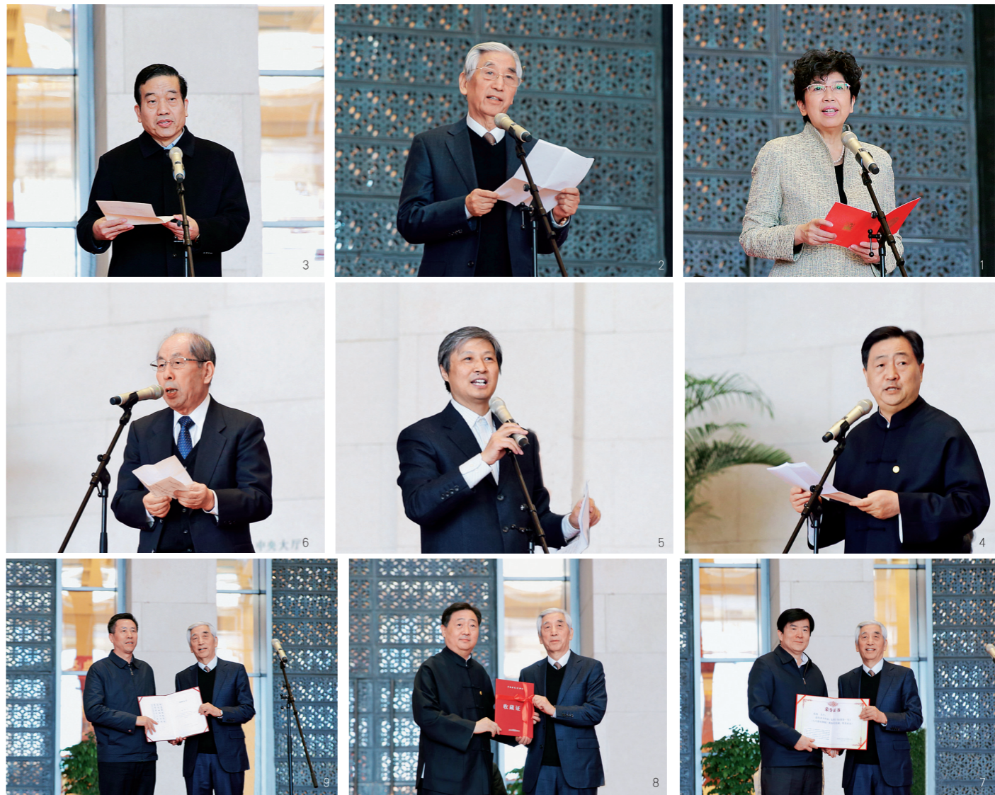
1、中国文联党组书记、副主席赵实致辞 2、中国书协名誉主席张海致答谢辞 3、中国书协主席苏士澍致辞 4、中国国家博物馆馆长吕章申致辞 5、中国书协分党组书记、驻会副主席陈洪武主持展览开幕式 6、全日本书道联盟副理事长清水透石致辞 7、中国文联党组副书记、副主席李屹向张海颁发收藏证书 8、中国国家博物馆馆长吕章申向张海颁发收藏证书 9、中国美术馆党委书记游庆桥向张海颁发收藏证书

规律和继承创新做了深入思考。他以『书中有文、书中有道、书中有德』为标准而不懈努力。 张海还将本次展览的部分作品捐赠给中国国家博物馆、中国美术馆和中国文联。李屹、游庆桥、吕章申分别向张海颁发了收藏证书。本次展览从三月二十日开始预展，三月二十六日正式开展，展期到五月十日结束。